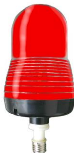
Lâmpada em Led's