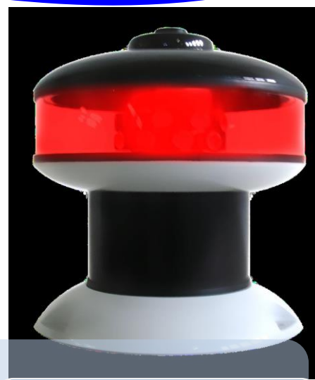
Basilador média intensidade 2.000 candelas