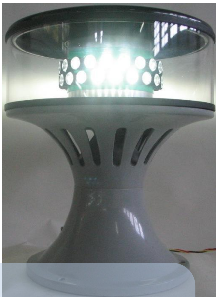
Basilador média intensidade 2.000 candelas noite / 20.000 dia